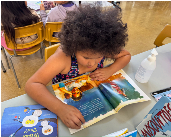
Un moment de lecture tranquille dans la nation crie d'Ermineskin (Alberta)

En 2025, les campeurs ont passé 33 435 minutes à lire , et les instructeurs leur ont lu 1 885 livres ! 84 % des parents ont déclaré que leur enfant lisait davantage depuis qu'il participait au camp.