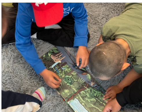
Campers reading together, Umiujaq (QC)

Littératie Ensemble recueille les commentaires et les sondages des participants, de leurs familles et de leurs communautés. Ces informations sont essentielles pour améliorer le programme du camp d'été de littératie. Nous voulons que nos activités de littératie restent une expérience d'apprentissage amusante pour tous ! Voici ce qui a été dit cette année à propos du camp d'un océan à l'autre.