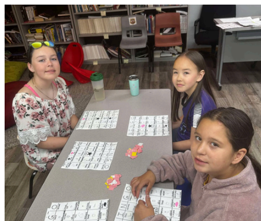
Jouer au BINGO avec des mots en anglais et en inuttut, Makkovik (Territoires du Nord-Ouest)

« Il est important d'apprendre à lire dès le plus jeune âge. [Mon enfant] avait hâte de se lever le matin. » - Parent, Naujaat (NU)