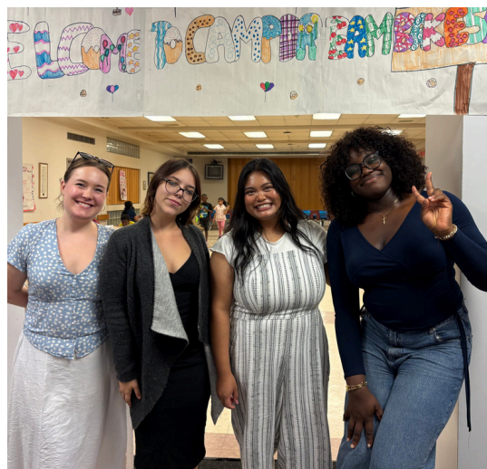
Instructeurs à Elmwood (Manitoba)

« Travailler comme animateur de camp m'a permis d'acquérir une créativité et des compétences en résolution de problèmes que je n'aurais pas eues autrement. »