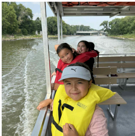
Campers from Waywayseecappo First Nation on a field trip (MB)