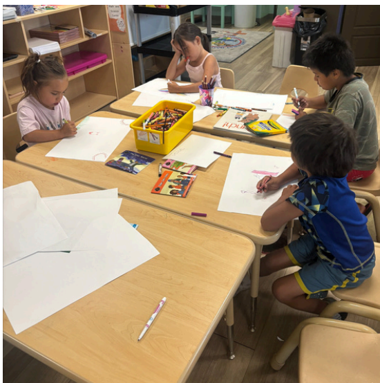
Making art in Sturgeon Lake Cree Nation (SK)