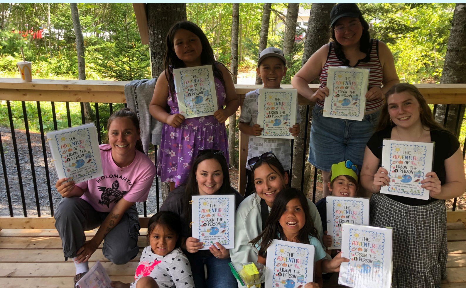
Des campeurs heureux de la Première Nation de Sitansisk (St. Mary's), au Nouveau-Brunswick, avec des exemplaires du livre qu'ils ont écrit ensemble.

– Éducateur et membre de la communauté, Première Nation Sitansisk (N.-B.)