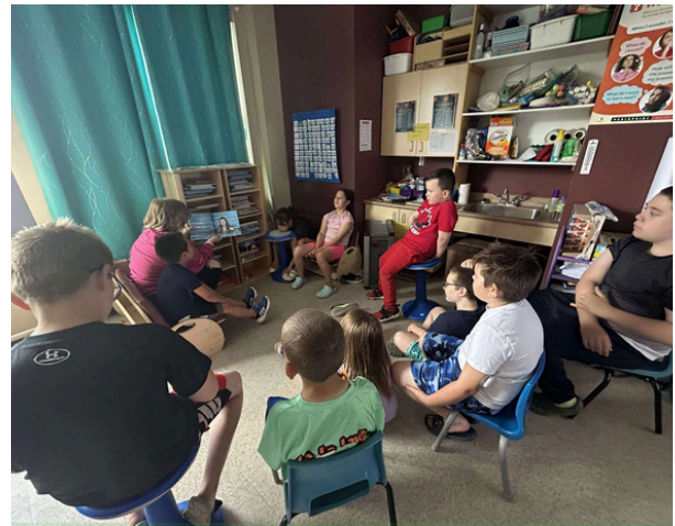
Des campeurs profitent d'une séance de lecture collective à Postville (NL)

« J'ai déjà remarqué un changement dans l'attitude de mon petit-fils envers la lecture ! »