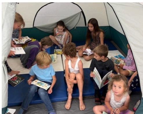
Moment de lecture tranquille dans une tente confortable à Nakina (ON)

Les élèves apprécient souvent de faire une pause scolaire pendant l'été. Malheureusement, cette pause peut avoir un impact négatif sur leur apprentissage. Un élève moyen peut perdre jusqu'à trois mois de ce qu'il a appris l'année précédente[i] s'il ne continue pas à s'investir dans son apprentissage. Cet effet est plus marqué chez les enfants issus de familles à faibles revenus ou défavorisées[ii]. Les activités proposées dans les camps permettent aux participants d'utiliser, et non de perdre, ce qu'ils ont appris pendant l'année scolaire précédente.