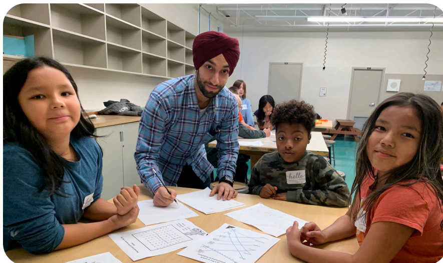
Apprentissage après l'école de Kent Road (MB)

Depuis 2022, Littératie Ensemble veille à ce que son engagement envers la justice, l'équité, la diversité et l'inclusion se reflète dans l'ensemble de son travail, quelle qu'en soit la portée. Nous souhaitons que les apprenants et les bénévoles se sentent en sécurité, soutenus et inclus, et que le personnel favorise des milieux de travail et d'apprentissage accueillants et inclusifs.