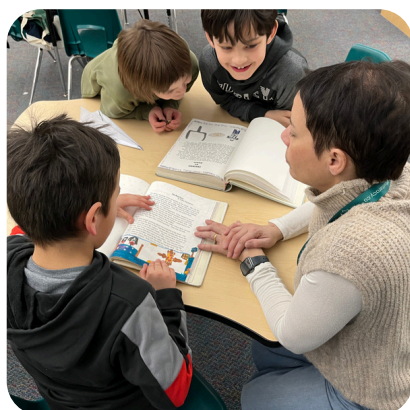
Grande Prairie, Alberta